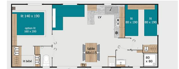
Mobilheim 4 Plätze