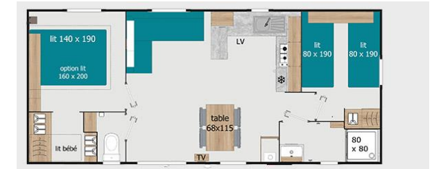
Mobilheim 4 Plätze