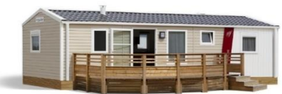
Mobilheim 6 plätze